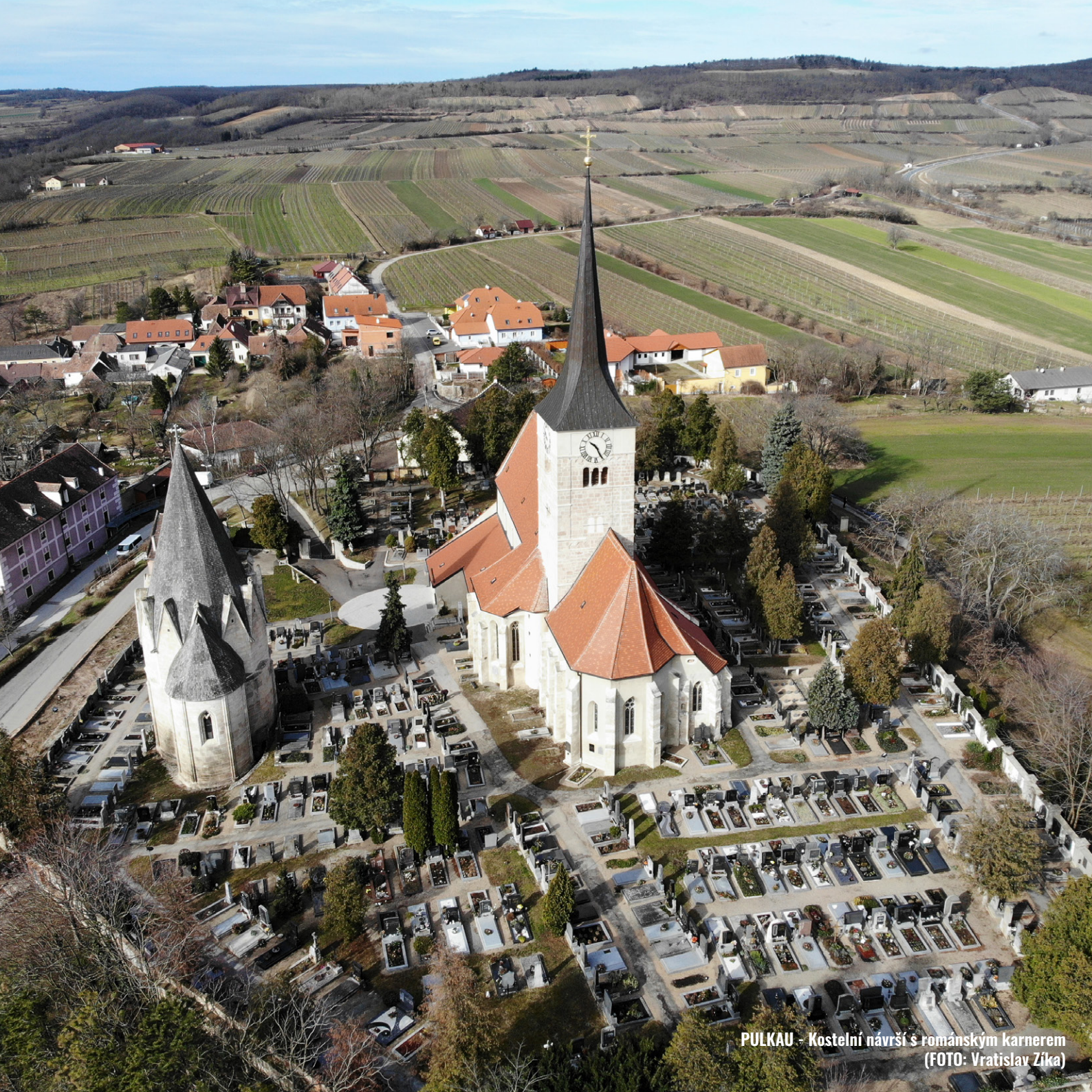
PULKAU - Kostelní návrší s románským karnerem