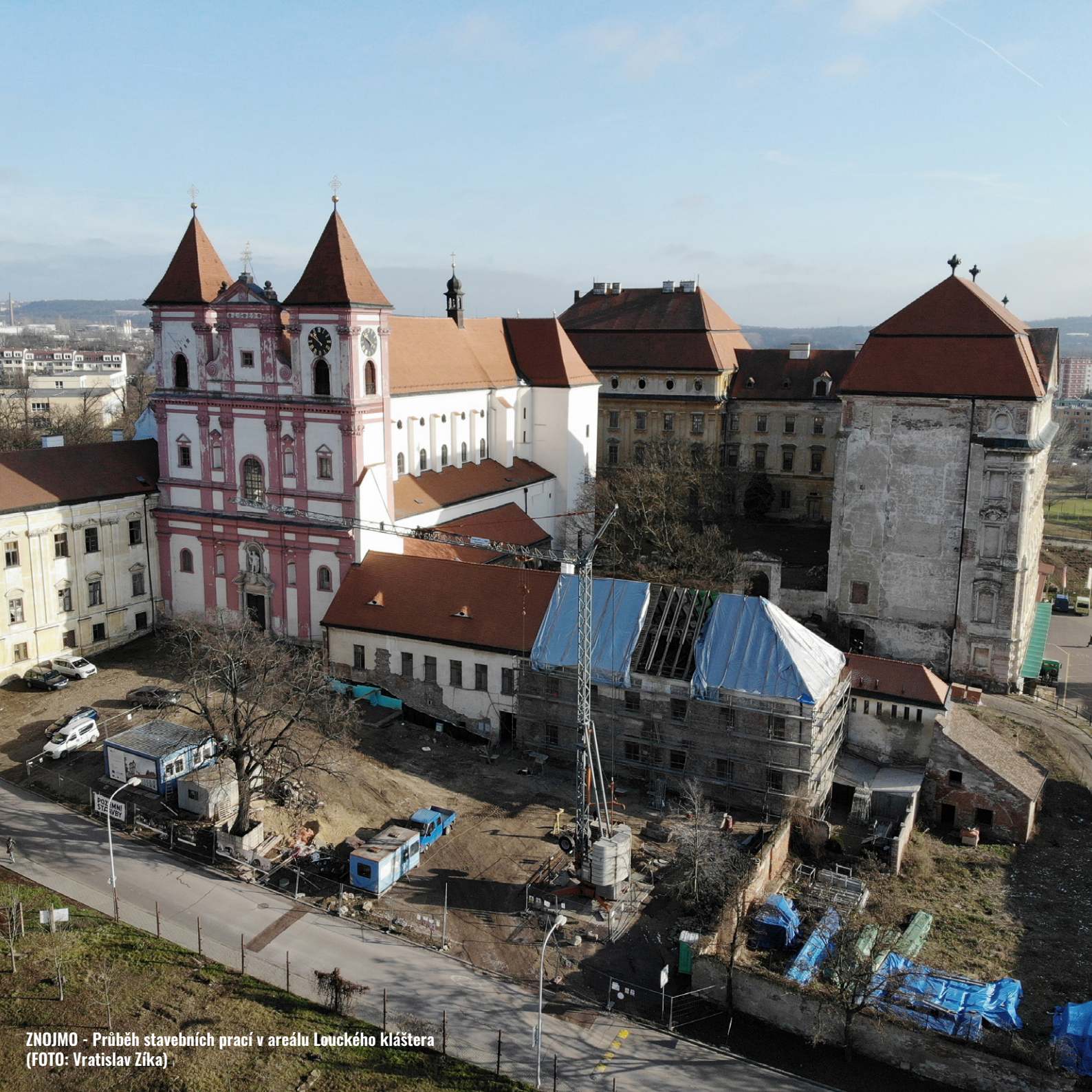
ZNOJMO - Průběh stavebních prací v areálu Louckého kláštera