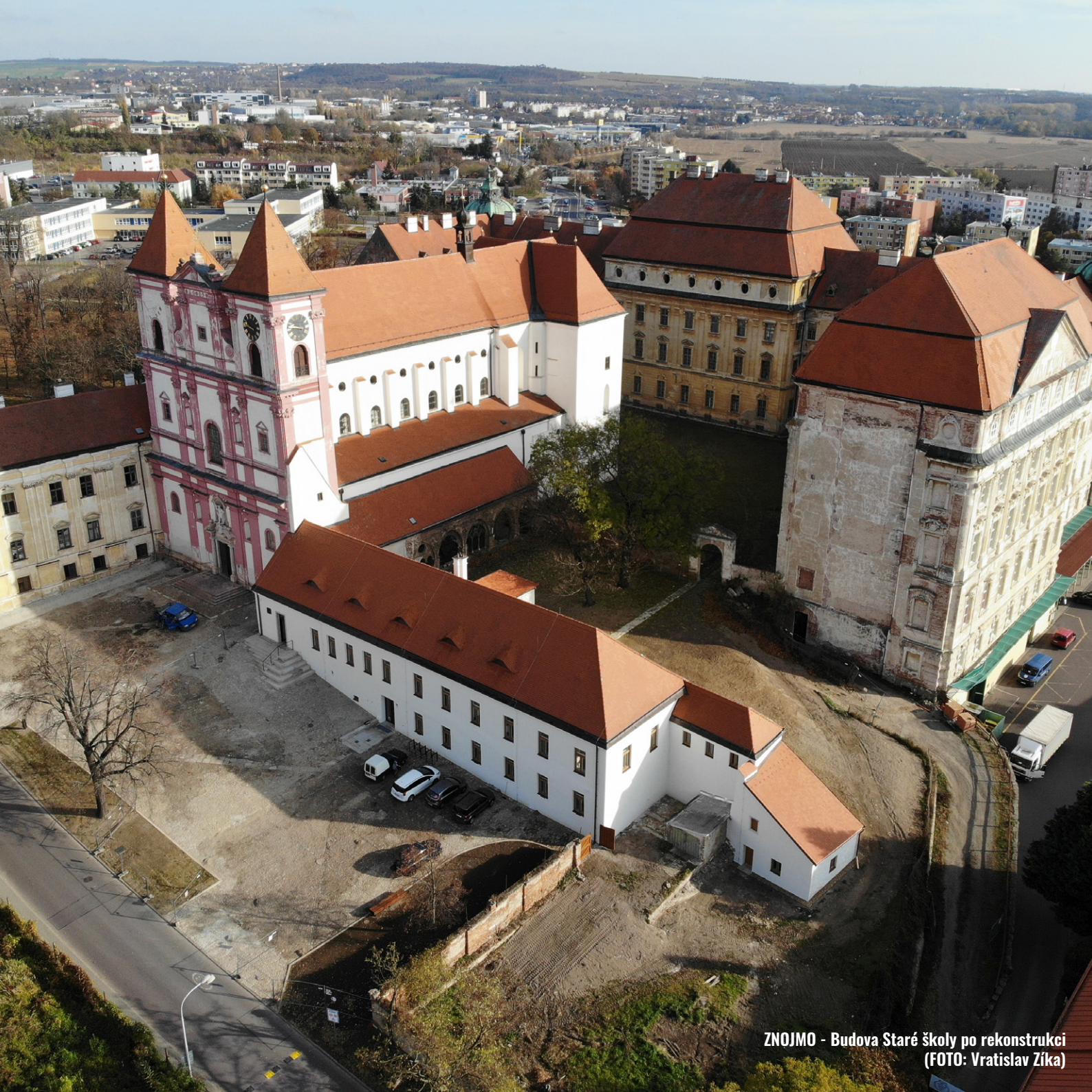
ZNOJMO - Budova Staré školy po rekonstrukci