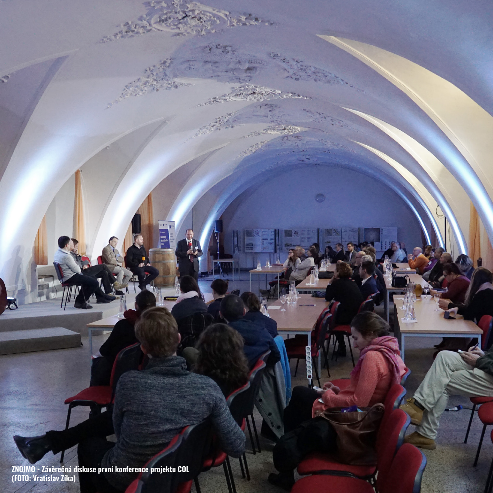
ZNOJMO - Závěrečná diskuse první konference projektu COL