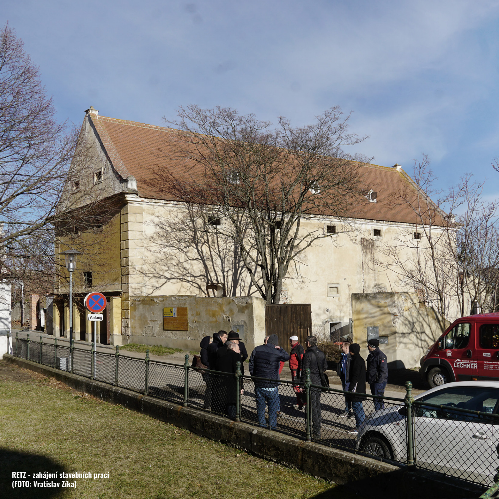
RETZ - zahájení stavebních prací