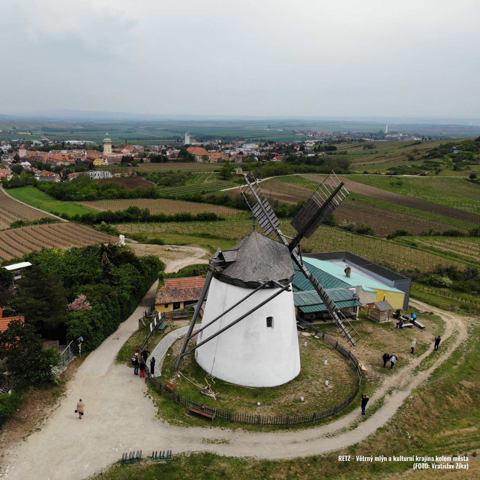
RETZ - Větrný mlýn a kulturní krajina kolem města