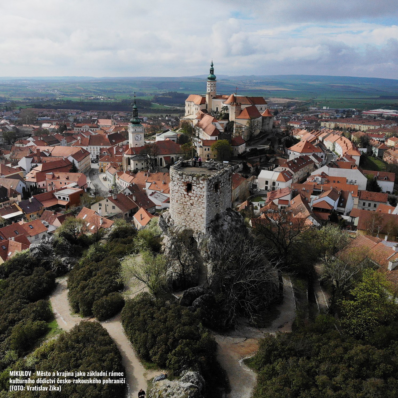
MIKULOV - Město a krajina jako základní rámec kulturního dědictví česko-rakouského pohraničí