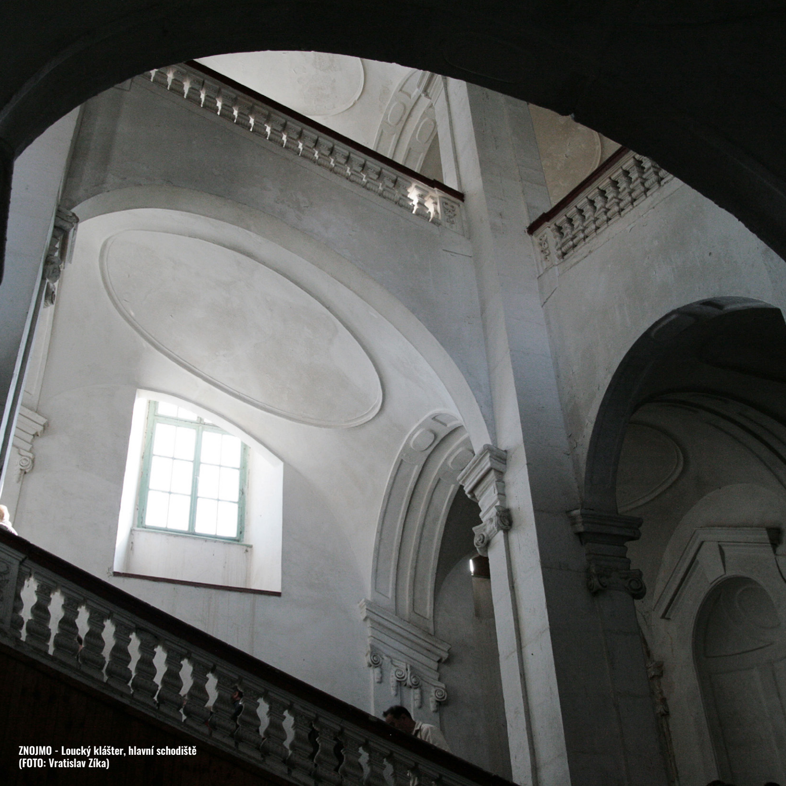
ZNOJMO - Loucký klášter, hlavní schodiště