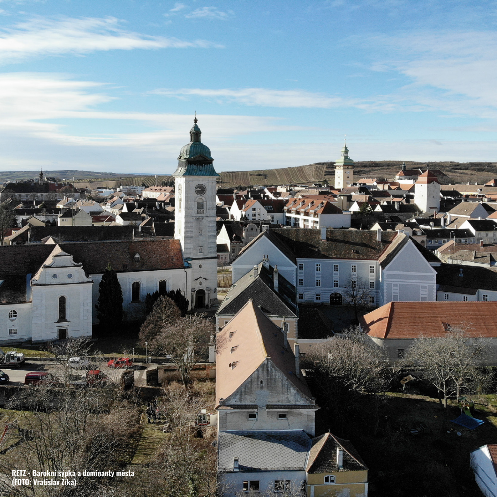
RETZ - Barokní sýpka a dominanty města