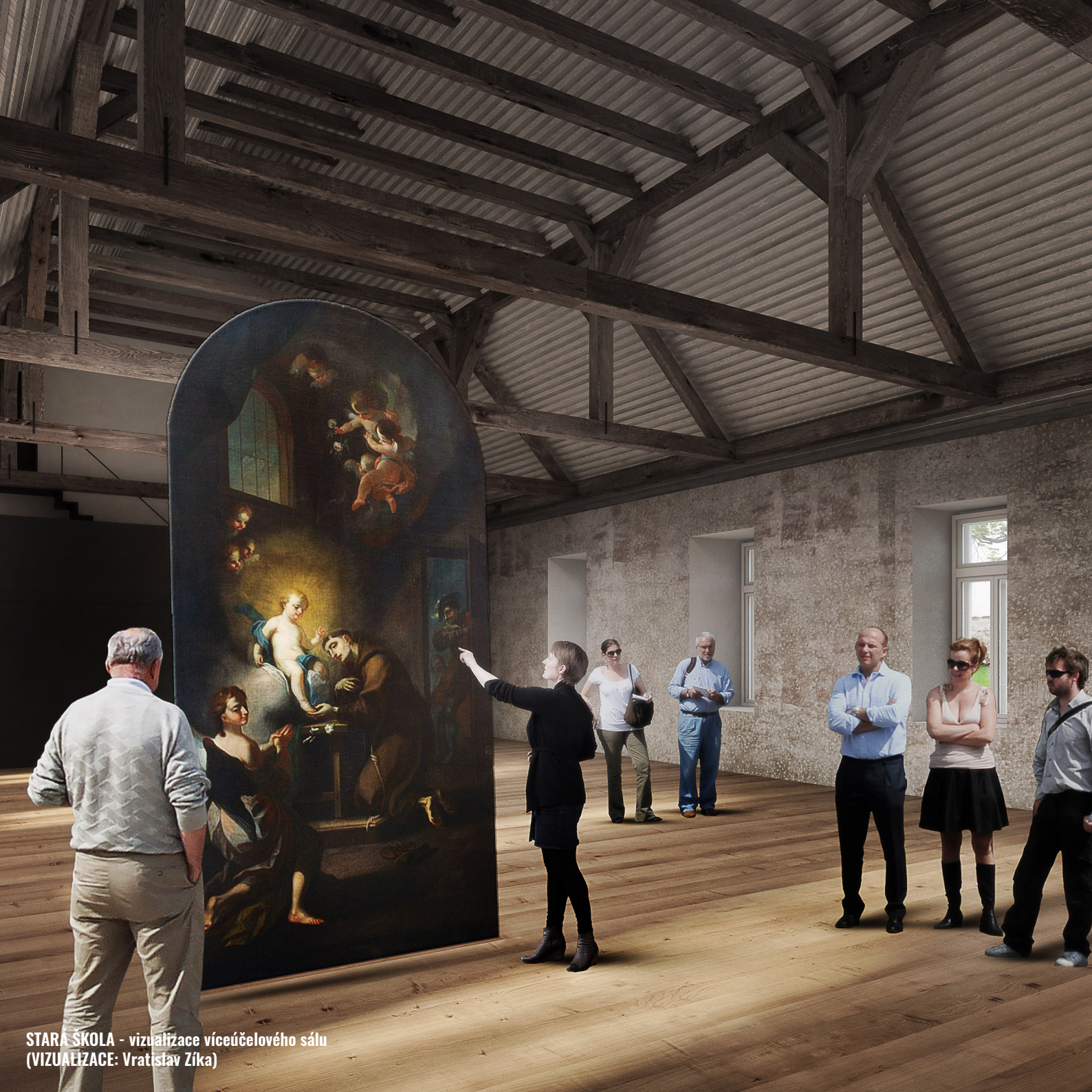
STARA ŠKOLA - vizualizace víceúčelového sálu (VIZUALIZACE: Vratislav Žíka)