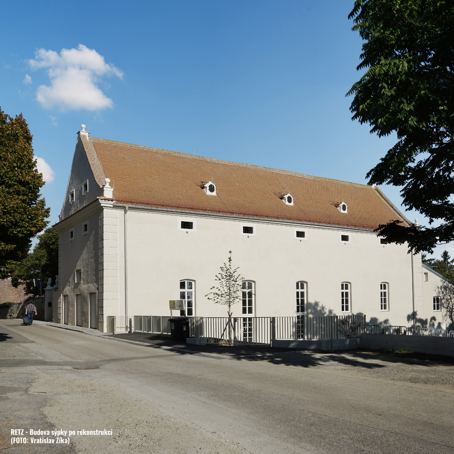
RETZ - Budova sýpky po rekonstrukci