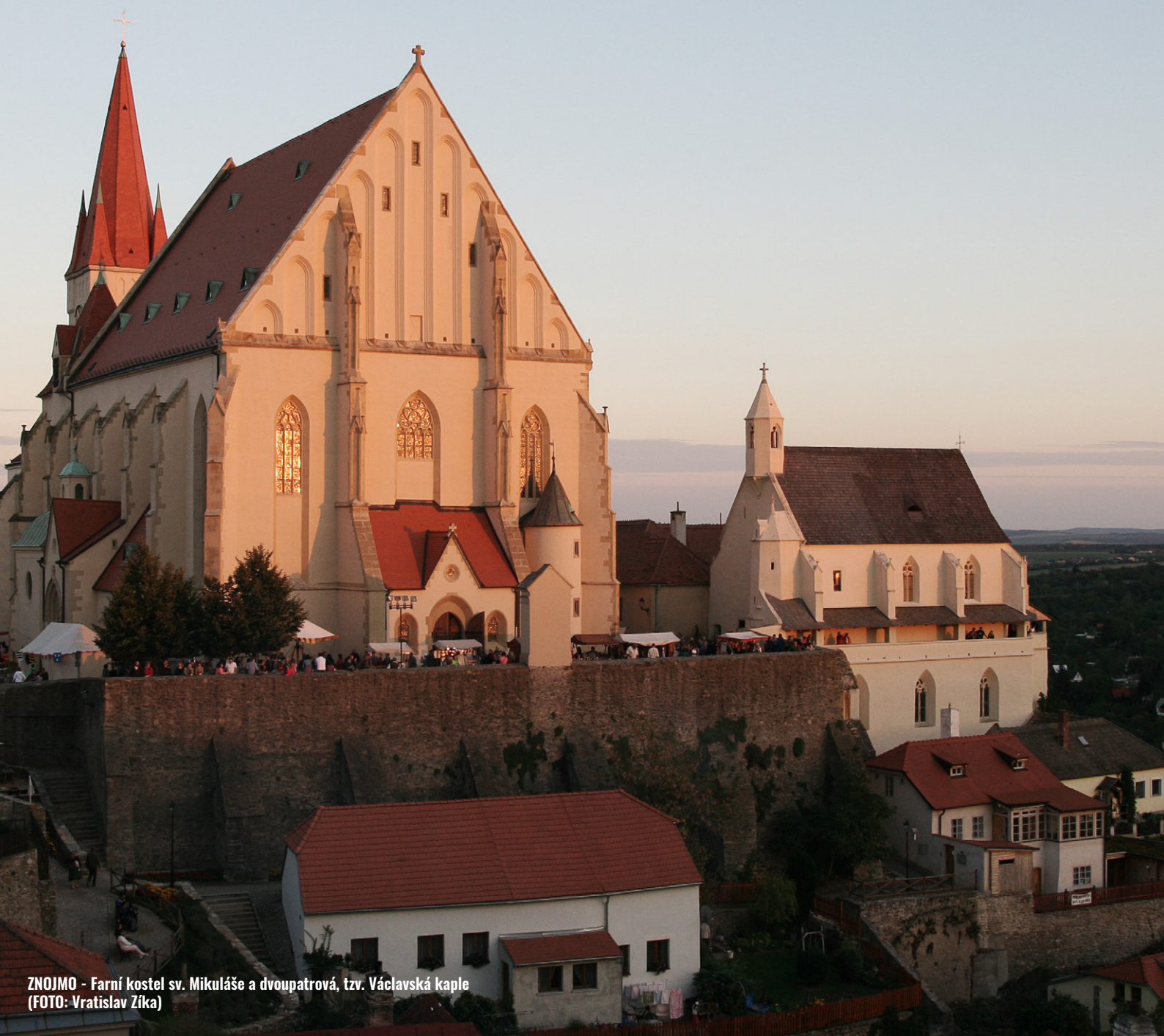
ZNOJMO - Farní kostel sv. Mikuláše a dvoupatrová, tzv. Václavská kaple